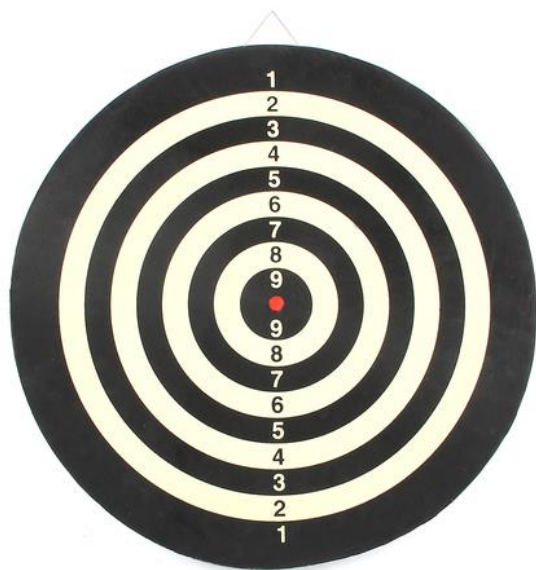
Рисунок 1 – Мишень для дартса